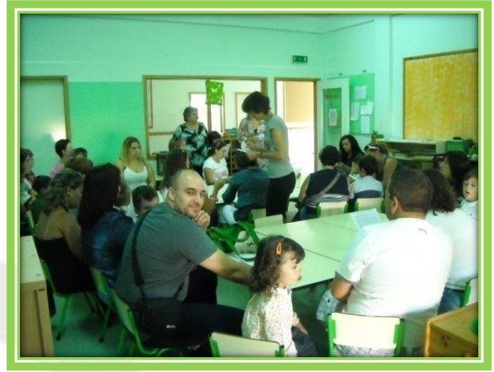
J.I. Nº 2 ( Brejo )